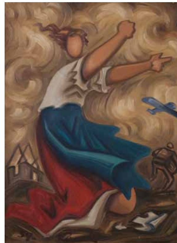
Josef Čapek Oheň 1939