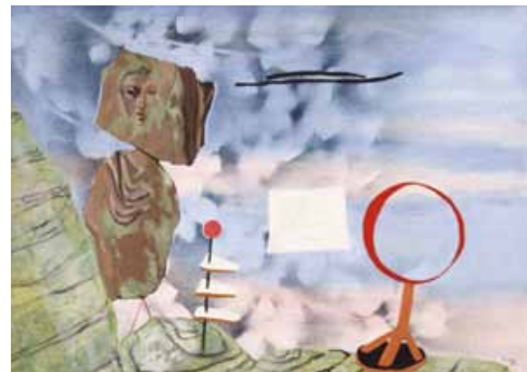
Jindřich Štyrský Obraz 1932