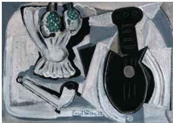
Emil Filla Hudební zátiší 1932