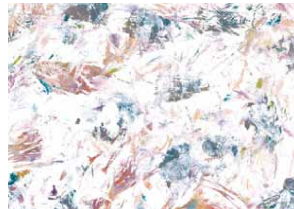
Vladimíra Drahozalová Z cyklu Nad hlavou 2015–2016