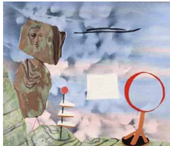
Jindřich Štyrský Obraz 1932

Cesty imaginace / Česká meziválečná avantgarda ze sbírek Alšovy jihočeské galerie (Z cyklu Regionální galerie ) 8. prosince 2016 – 12. února 2017