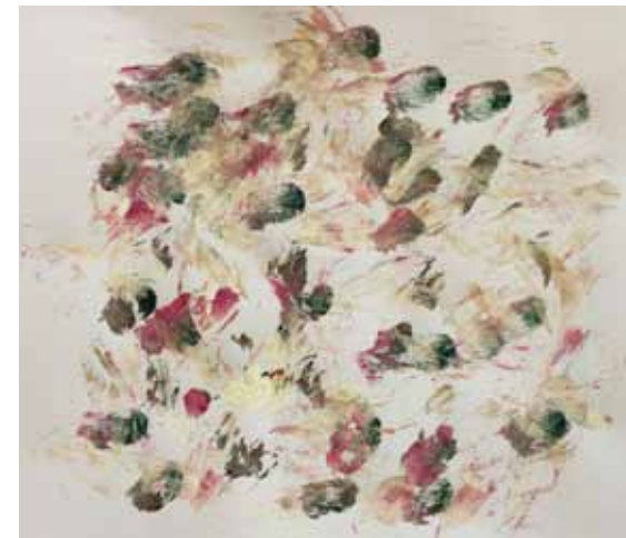
Vladimíra Drahozalová Nad hlavou 2016

Vladimíra Drahozalová / Nad hlavou (Z cyklu Nová jména ) 8. prosince 2016 – 12. února 2017