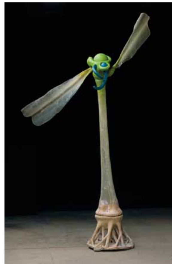
Karel Pauzer Vážka 2009