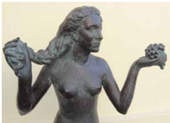
Jan Štursa Dar nebes a země 1918

Jan Štursa / Dar nebes a země 29. června – 10. září 2017 (Z cyklu Počátky moderny )