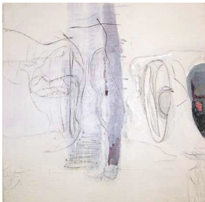
Marian Volráb, Jiné tváře, 2004, AKRYL, PLÁTNO, 75 X 75 CM