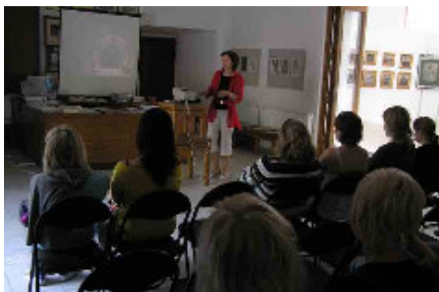
Přednáška pro studenty o historii města Roudnice s promítáním diapozitivů

Galerie pravidelně připravuje cykly edukativních programů pro děti a mládež od předškolního věku až po studenty středních škol. Na všechny doprovodné programy a programy pro školy poskytuje galerie slevy na vstupném.