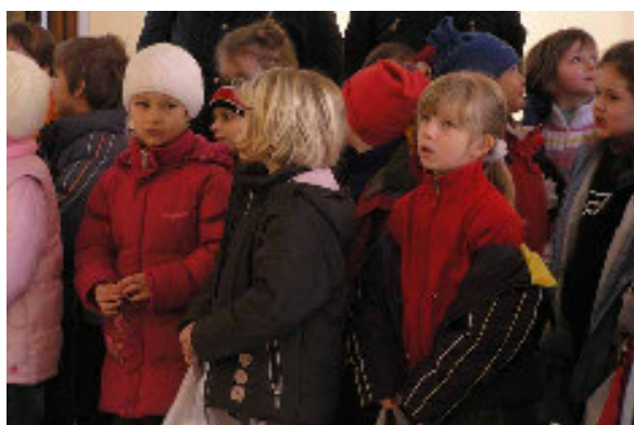
Děti z roudnické mateřské školy