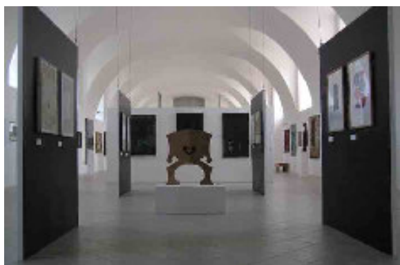
Záběr do instalace výstavy Lettrismus - předchůdci a následovníci

V Galerii moderního umění v Roudnici nad Labem bylo v roce 2008 zpřístupněno veřejnosti 7 originálních výstavních projektů, jejichž působení na veřejnost umocnila řada doprovodných aktivit, rozšiřujících škálu metod o specializované programy. Každá z výstav měla svůj specifický charakter. Některé tituly byly založeny na původní heuristické práci. Platí to zejména pro projekt Lettrismus – předchůdci a následovníci . Výstava objevným způsobem promlouvala o hledání kořenů ve vývojové linii této tendence francouzského původu, která se naplno rozvinula v českém prostředí v období šedesátých let dvacátého století. Autorka výstavy dr. Miroslava Hlaváčková však ještě navíc zkoumala další pokračování a vyústění v aktuálním umění. Výstava tak sklenula pozoruhodný oblouk od počátků dvacátého století do současnosti. Přínosem výstavy bylo též začlenění celé řady děl od slavných, ale i neznámých autorů. Představila se tak velká širší problematiky nejrůznějšího typu využití písma jako výtvarného znaku.