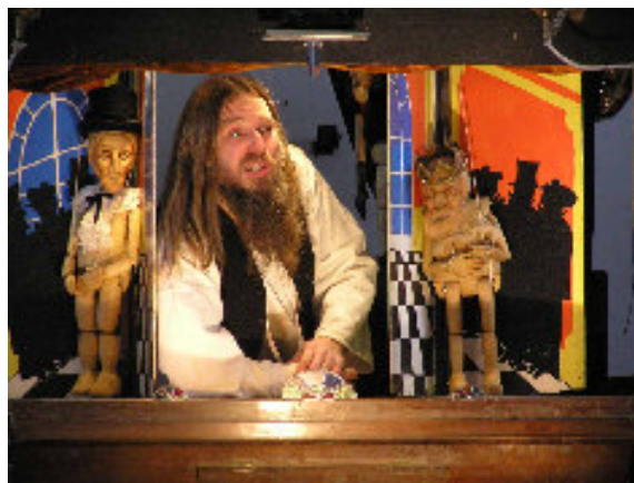
Divadelní představení „Popelka“ v podání Teátru Vítů Marčička

Beseda s Jiřím Šindlerem /v rámci výstavy Jiřího Šindlera Od písma k obrazu/ termín: 29. 5. 2008