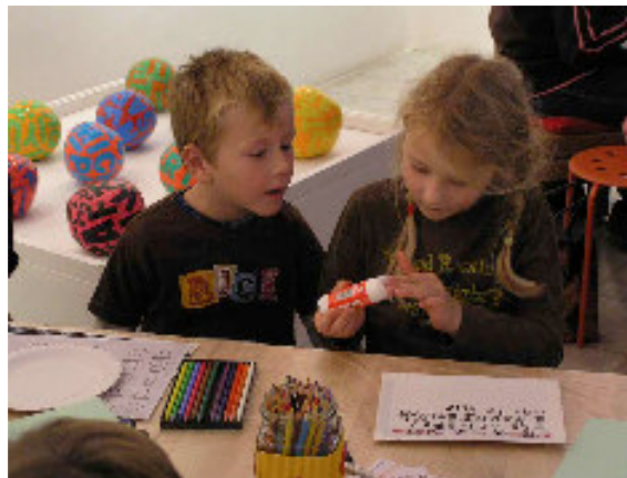
Záběry z Dětské výtvarné dílny „Písmenka kam se podíváš“ v rámci výstavy Lettrismus - předchůdci a následovníci