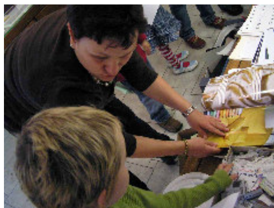
Záběr z výtvarné dílny „Písmenka kam se podíváš“ v rámci výstavy Lettrismus