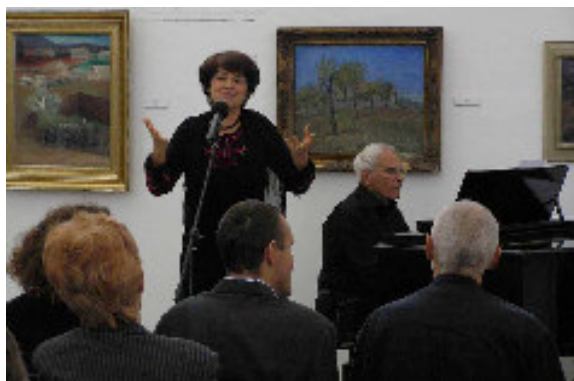
Zlatá éra francouzského šansonu v rámci výstavy Lettrismus