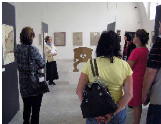
Komentovaná prohlídka výstavy Lettrismus - předchůdci a následovníci