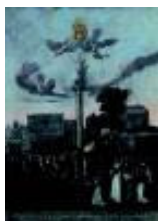
VÝSTAVA JEDNOHO OBRAZU (Pohledy do sbírek GMU)