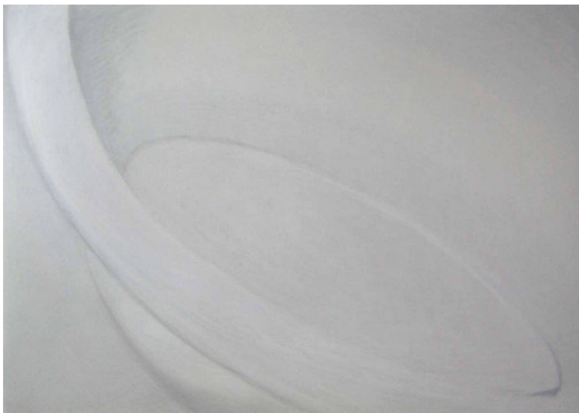
Jitka Svobodová, Lavor, 2002, pastel, papír, 100 x 140 cm