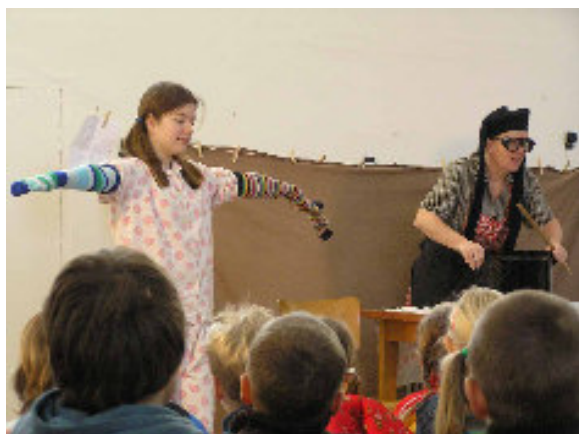
Divadelní představení „Do velké krajiny Dudědu“