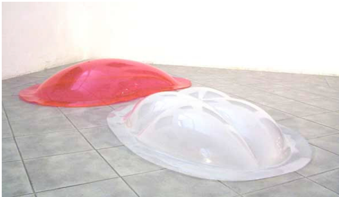
Miloš Ševčík, Bez názvu, (1970), objekt z průsvitného růžového a bílého umaplexu, v. 30 cm, d. 120 cm, š. 60 cm