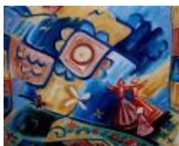
JOSEF ČAPEK – ZEMĚ A LIDÉ (Osobnosti)