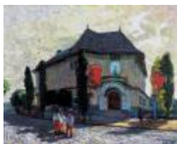
SDRUŽENÍ VÝTVARNÝCH UMĚLCŮ MORAVSKÝCH ve spolupráci s GVU v Hodoníně (Regionální galerie)