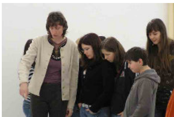
Studenti roudnického gymnázia

Celková návštěvnost se oproti roku 2007 opět zvýšila.