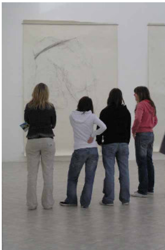
Výstavy Adrieny Šimotové „Perforace, kresby 1975 – 85“