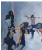
FRANTIŠEK RONOVSKÝ VZPOMÍNKY 1965 – 1970 (Osobnosti)